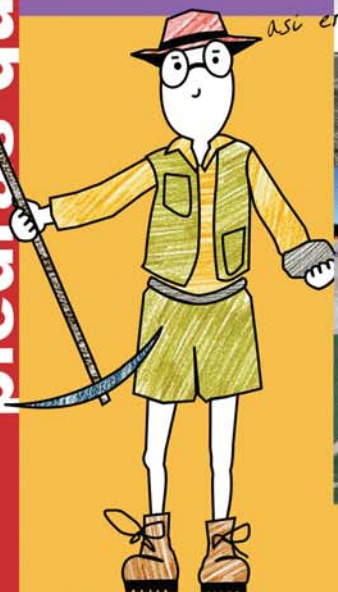
así era en 1986

Observa las columnas que hemos levantado y verás las inscripciones que grabaron quienes las hicieron. ¡Incluso algunos siglos después los árabes volvieron a escribir en una de ellas!