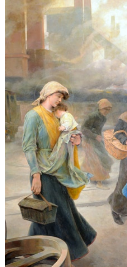
Vicente Cutanda y Toraya (Madrid, 1850-Toledo 1925) Ensueño o Virgen Obrera (1897) Óleo sobre lienzo