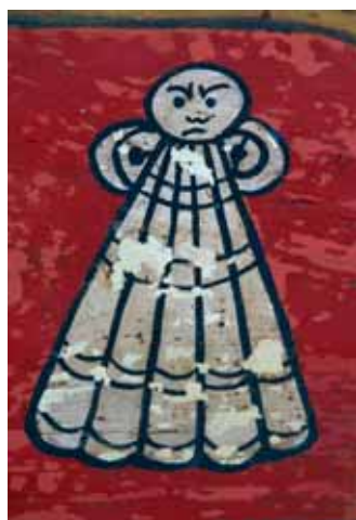
Detalle de una concha de Santiago.

En cuanto al tratamiento pictórico, conserva una decoración de vivos colores con un dibujo lineal y sencillo, de tintas planas que permite interpretar el discurso iconográfico a gran distancia reconociendo la heráldica representada. La pincelada suelta se encuentra en los pequeños detalles donde podemos encontrar decoraciones más elaboradas. Una parte relevante de este repertorio corresponde a la tradición ornamental occidental o cristiana que corresponde a los escudos heráldicos, conchas de Santiago, y en general todas las representaciones figurativas, mientras que los elementos geométricos y motivos vegetales o ataurique corresponden a la tradición ornamental Islámica.