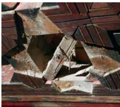
Detalle de la pérdida de piezas que forman la lacería.