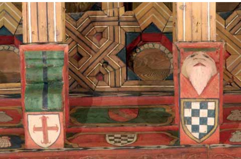
Fotografía después de la restauración.