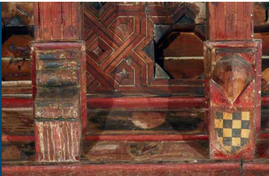
Fotografía antes de la restauración.