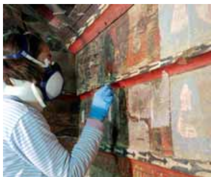
Proceso de consolidación de la capa pictórica.