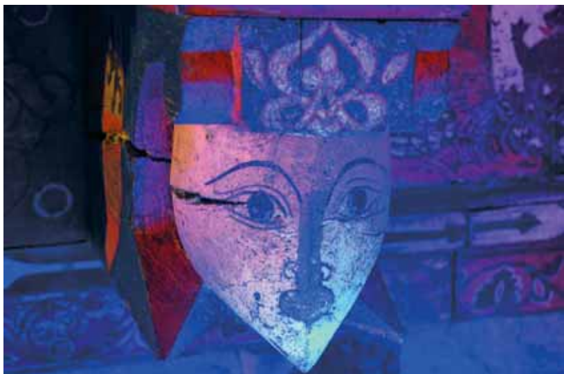
Fotografía ultravioleta para la detección de repintes.