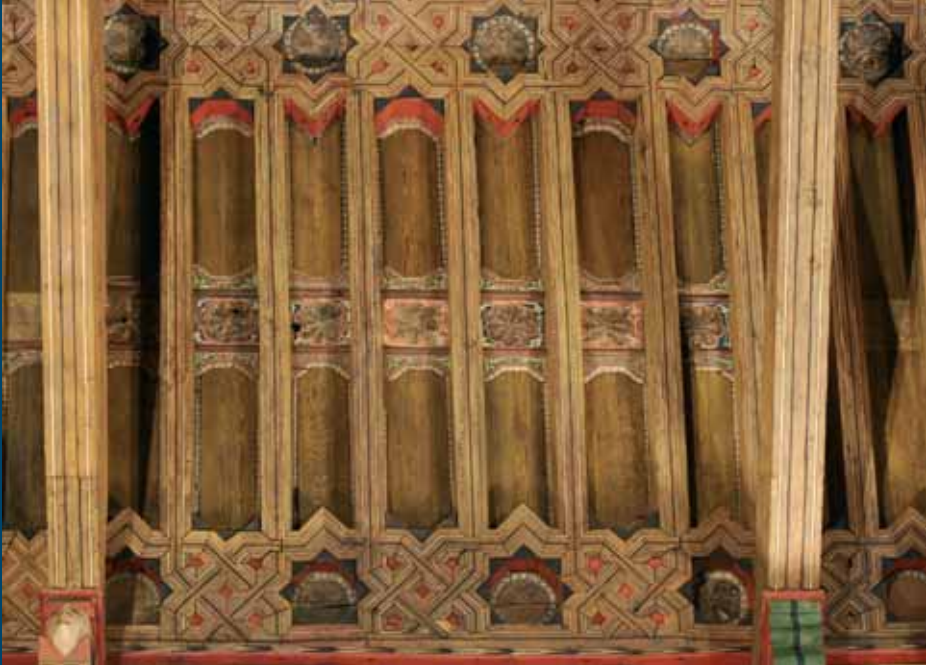
Detalle de la decoración original que se conserva en los faldones.