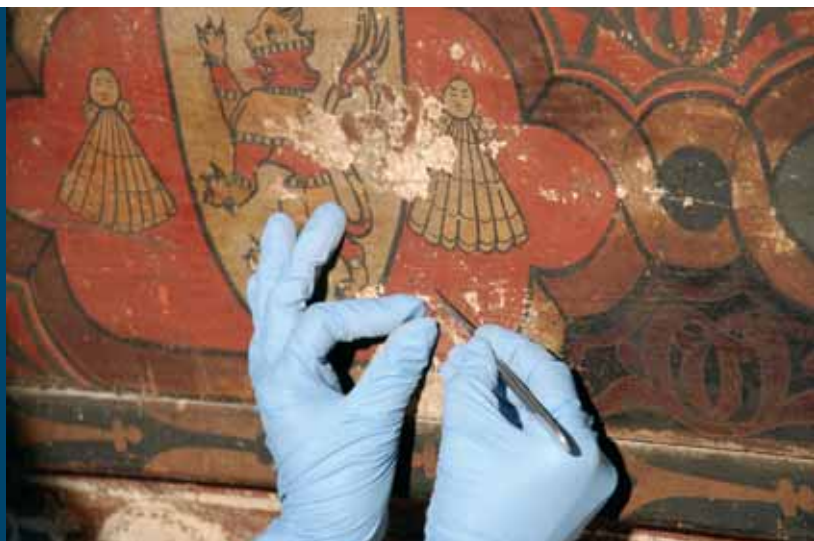
Proceso de toma de muestras.