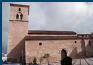
Iglesia de Santiago.

Moneda perteneciente al reinado de Enrique III rey de Castilla (1390-1406) hallada en la Armadura.