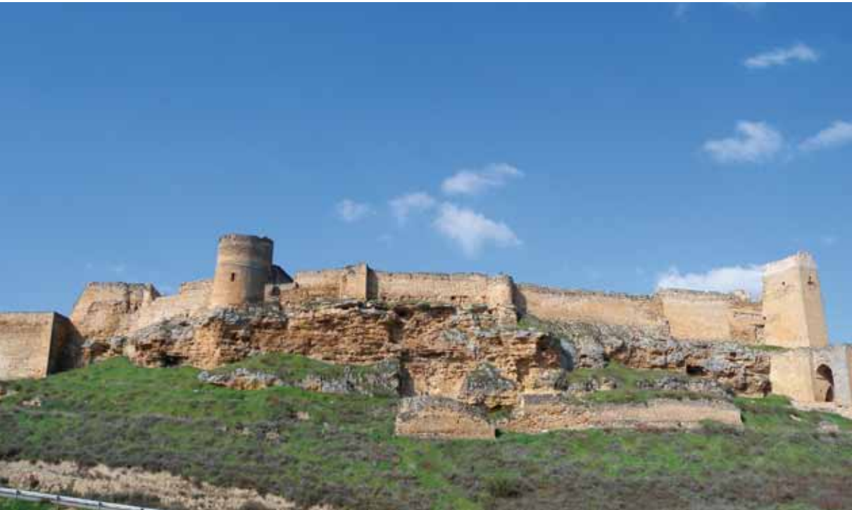
Perfil del Castillo de Zorita de los Canes