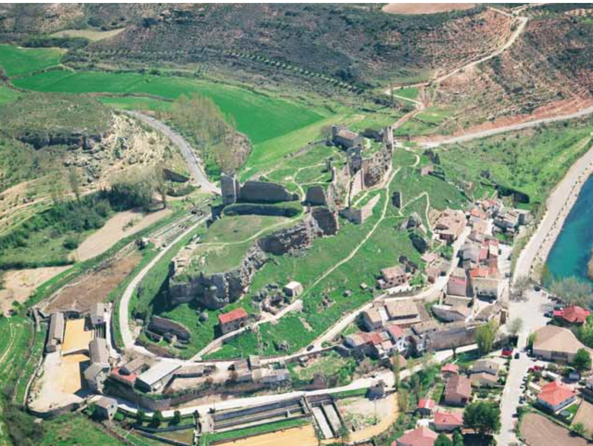
Vista aérea del Castillo de Zorita de los Canes