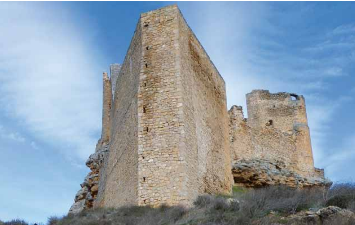
Torre del Espolón, en primer plano

A lo largo del siglo XV y al igual que otros castillos, Zorita dejó de ser residencia de los comendadores calatravos, quienes preferían las casas de encomienda en localidades próximas como Pastrana, convirtiéndose en un castillo-arsenal, custodiando armas de fuego, de propulsión, armaduras, munición y diverso utillaje para la conservación y fabricación de las mismas. En el siglo XVI se acometerá la última obra estructural del castillo, la torre del Espolón, conjunto preparado para soportar fuego artillero, adaptándose a nuevas necesidades militares en el contexto de la Guerra de las Comunidades contra Carlos V (1520-1523).