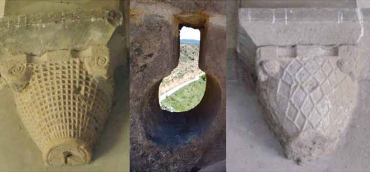
Ménsula-capitel de la iglesia