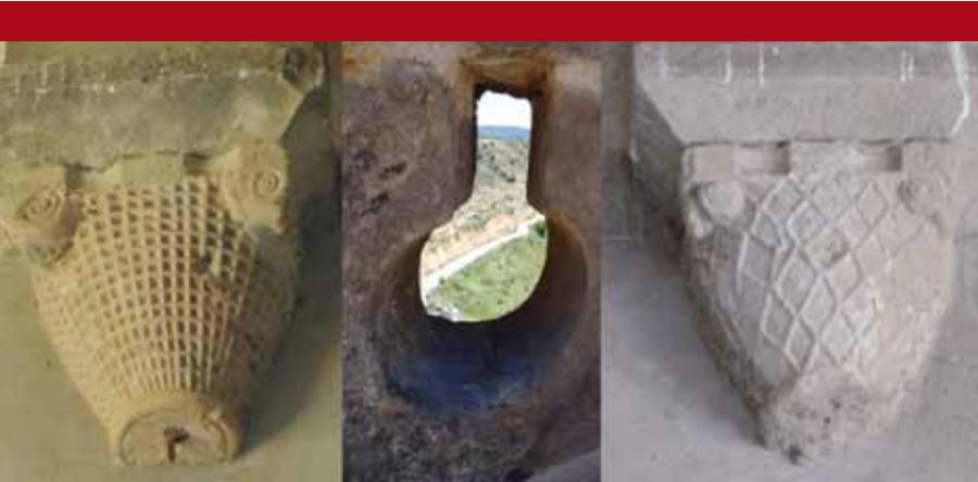
Ménsula-capitel de la iglesia

En Zorita, la Orden se volvió a organizar, se rearmó y, una vez fortalecida, se entregó a nuevas estrategias para la recuperación y control del territorio, siendo la batalla de las Navas de Tolosa el fin del poder almohade en la Península. Tras esta victoria cristiana, la Orden instaló definitivamente su sede en Calatrava la Nueva, construcción concebida para soportar un asedio a gran escala y evitar sorpresas como la de Alarcos.