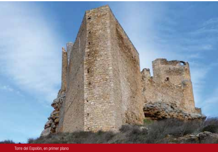
Torre del Espolón, en primer plano

A lo largo del siglo XV y al igual que otros castillos, Zorita dejó de ser residencia de los comendadores calatravos, quienes preferían las casas de encomienda en localidades próximas como Pastrana, convirtiéndose en un castillo-arsenal, custodiando armas de fuego, de propulsión, armaduras, munición y diverso utillaje para la conservación y fabricación de las mismas. En el siglo XVI se acometerá la última obra estructural del castillo, la torre del Espolón, conjunto preparado para soportar fuego artillero, adaptándose a nuevas necesidades militares en el contexto de la Guerra de las Comunidades contra Carlos V (1520-1523).