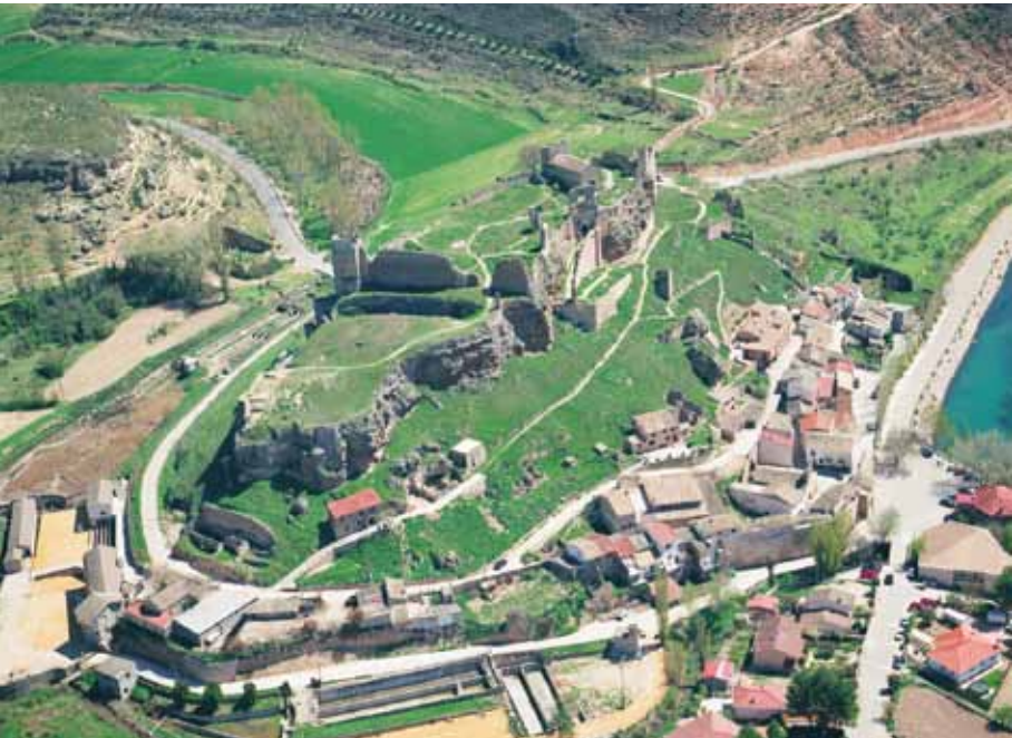
Vista aérea del Castillo de Zorita de los Canes

“ Zorita es fuerte porque está hecha con piedras de Recópolis”