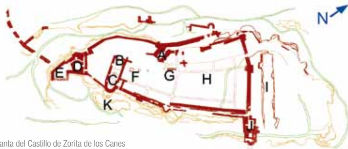
Planta del Castillo de Zorita de los Canes