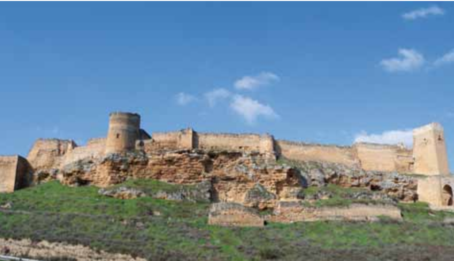
Perfil del Castillo de Zorita de los Canes