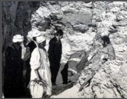
Izquierda: momia de Ahmose. Derecha: Maspero y los hermanos Abd el-Rassul en la entrada de la tumba DB 320