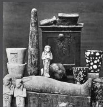
Izquierda: sarcófagos procedentes de la Cachette. Museo de Bulaq. Derecha: diversos objetos hallados en la tumba DB320